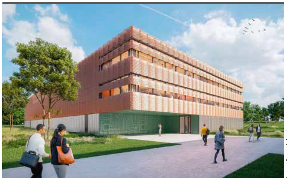
Benithem Crouwel Architects

9 Prozent jährlichem Zuwachs an Rechenleistung steigen gleichzeitig die Investitionen in Gebäude und technische Gebäudeausrüstungen auf ein neues Allzeithoch. So fließen nach Bitkom-Angaben 2025 allein