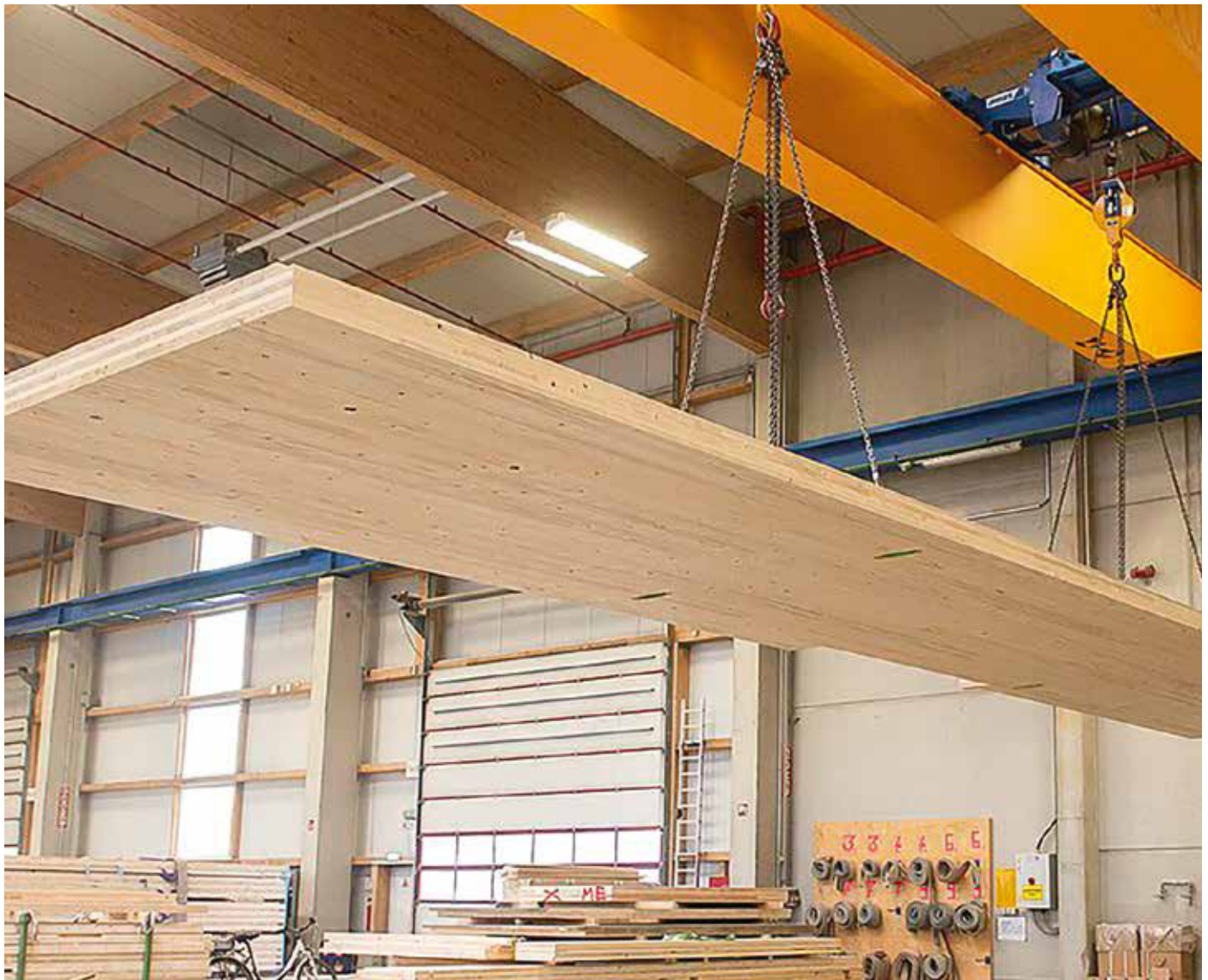
Brettspertholz ist ein industriell gefertigtes flächiges Holzprodukt für tragende Konstruktionen. Es wird als Platten- oder Scheibenelement eingesetzt und besteht aus kreuzweise miteinander verleimten Lagen aus Nadelvollholz.

Strom aus erneuerbaren Energien decken. Ebenso gibt es klare Vorgaben zum PUE-Wert (Power Usage Effectiveness). Dieser bewertet die Energieeffizienz des Rechenzentrums. Für die Berechnung wird die zugeführte Energie durch die von den IT-Geräten verbrauchte Energie geteilt. Demnach müssen Rechenzentren, die vor dem 1. Juli 2026 den Betrieb aufnehmen/aufgenommen haben, ab dem 1. Juli 2027 einen PUE-Wert von \leq 1,5 und ab dem 1. Juli 2030 einen PUE-Wert von \leq 1,3 im Jahresdurchschnitt dauerhaft erreichen. Ab dem 1. Juli 2026 in Betrieb genommene Rechenzentren müssen einen PUE-Wert von \leq 1,2 spätestens zwei Jahre nach Inbetriebnahme im Jahresdurchschnitt